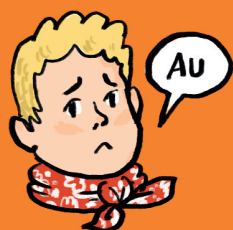
bolest v krku