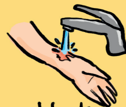
chladit studenou vodou