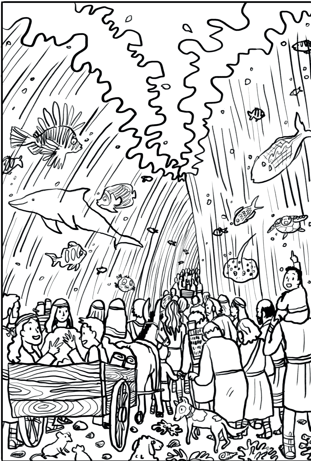
Mojžíš vyvádí Boží lid z Egypta. V cestě jim stojí moře, ale na Mojžíšův příkaz se vody rozestoupí a Izraelité bezpečně projdou suchou nohou na druhý břeh.